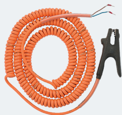
Спиральный кабель до 15 м