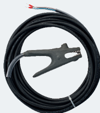
Гладкий кабель до 30 м