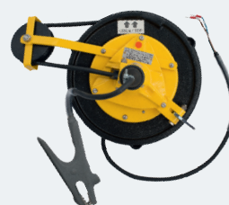
Кабельный барабан до 10 м